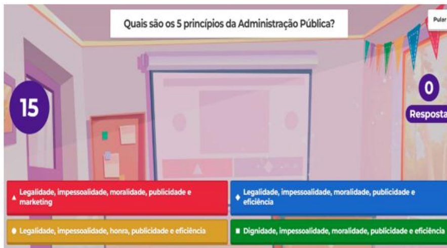
Figura 3. Site do Kahoot (tela do jogador do quiz).

Por fim, é fundamental destacar que o uso de ferramentas tecnológicas desempenhou um papel fundamental durante a intervenção pedagógica. Aproveitou-se favoravelmente o fato de que os recursos tecnológicos são predominantes como ferramentas de comunicação entre os alunos, e, portanto, eles possuem habilidade no manuseio desses dispositivos. Essa proficiência foi crucial para que os discentes pudessem desenvolver as atividades propostas com o uso de dispositivos digitais.