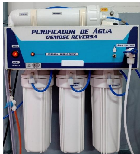
Figura 2. Purificador de água com Osmose Reversa, filtros e UV

As medidas da condutividade elétrica (CE) e de sólidos dissolvidos totais (SDT) da água proveniente do ar-condicionado e do sistema de purificação foram feitas em condutivímetro de bancada, calibrado com solução padrão de 146,9 \mu\text{Scm}^{-1} , sendo esta