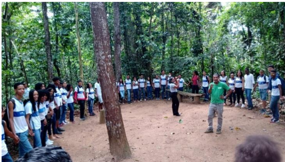
Figura 1. Aula de campo Espaço de silêncio Mãe Natureza, aula de campo no Jardim Botânico, Salvador BA.