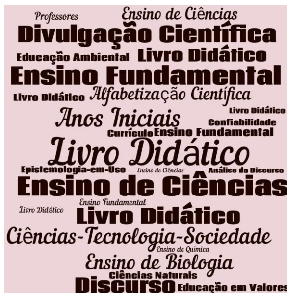
Figura 2. Nuvem de palavras composta por palavras-chave dos artigos.

Mediar informações a respeito de pesquisas para as suas próprias divulgações é algo importante no meio acadêmico, e é comum termos conceitos que representam os conteúdos em questão. Segundo Tonello et al. (2012), as palavras-chave preenchem bem esse espaço, servindo como transição de informações de forma simples e organizada a partir da identificação dos conceitos mais significativos de um texto em questão. Porém, mesmo com tanto alcance e significado para pesquisas como essa, os artigos pesquisados ainda ficam carecendo de palavras chaves mais precisas para um desempenho de uma Nuvem de Palavras significativa.