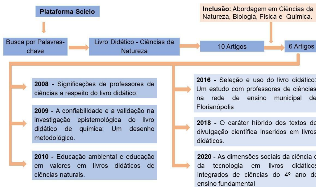
Figura 1. Fluxograma da seleção dos artigos analisados.

na segunda metade do século XX. Em meados dos anos 2000, observamos um crescimento nessas pesquisas sobre o LD (BAGANHA, 2010; BITTENCOURT, 2004; NÚÑEZ et al., 2003). As contribuições e informações desses autores nos ajudam a entender o contexto da realidade com a qual trabalhamos neste estudo (ROSA e MOHR, 2016).