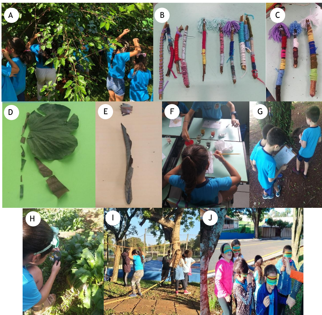
Figura 1. Etapas da vivência didática. Legenda: A - A descoberta do pé de amora; B - Bonecos e gravetos mágicos; C - Alfabeto da Natureza; D - Entre cores e sabores: vivência com tintas produzidas com pigmentos naturais; E - O laboratório vivo presente na escola; F - A natureza como um espaço para o brincar. Fonte: As autoras (2022).

Como atividade final desse encontro, visitou-se uma pequena área dentro da escola, que não é cimentada e que possui uma diversidade de plantas frutíferas (gabiropa, amora, mamão, laranja, pitanga, abacaxi), medicinais (açafraão, alecrim, capim-cidreira, melissa), ornamentais, como a margarida e outras, que não foi possível identificar (Figura 1A).