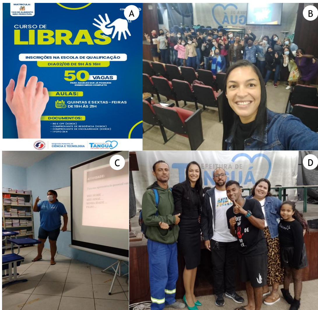
Figura 2. Imagens da vivência didática. Legenda: A - Cartaz de divulgação do curso de Libras; B - Aula prática com alunos do comércio local; C - Aula prática com alunos de órgãos públicos da prefeitura; D - Participação da comunidade surda na formatura.

A primeira consistiu na divulgação do projeto junto ao comércio local, profissionais da saúde, funcionários públicos e comunidade em geral, por meio de um cartaz (Figura 1A).