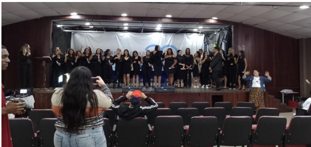
Figura 2. Formatura de alunos do comercio local

Na solenidade de formatura (Figura 2) os cursistas foram orientados a vestir indumentárias na cor preta, uma vez que treinaram, nos encontros anteriores da formatura, a apresentarem em Libras uma música.